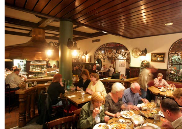
Härke BrauereiAusschank, Peine