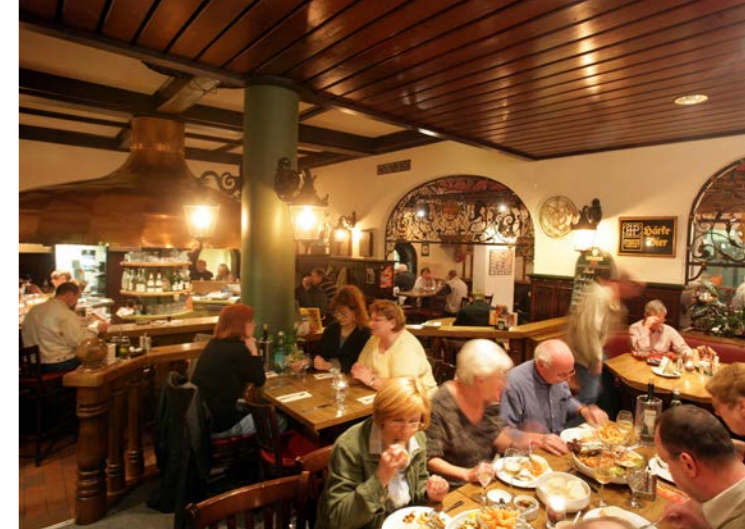
Härke Brauerei Ausschank, Peine