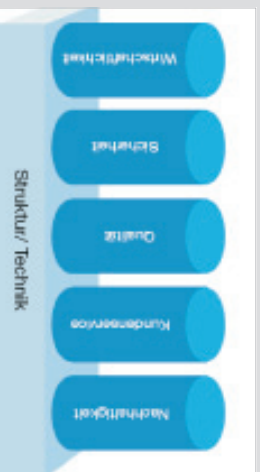
5 Säulen der Beurteilung der Leistungsfähigkeit

Empfohlen vom Niedersächsischen Ministerium für Umwelt und Klimaschutz, dem Ministerium für Landwirtschaft, Umwelt und ländliche Räume Schleswig-Holstein und dem Senator für Umwelt, Verkehr und Europa der Freien Hansestadt Bremen, wird mit dem Projekt „Benchmarking Abwasser-Nord“ die erforderliche Standortbestimmung auch im Bereich Abwasser angegangen.