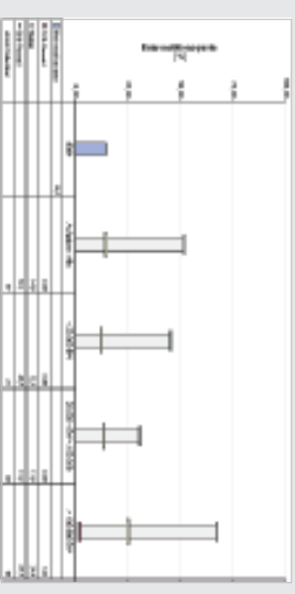
Reinvestitionsquote der Aufgabe „Abwasser Ableiten“, Einzelwert im Vergleich unterschiedlicher Größenklassen der Betreiber